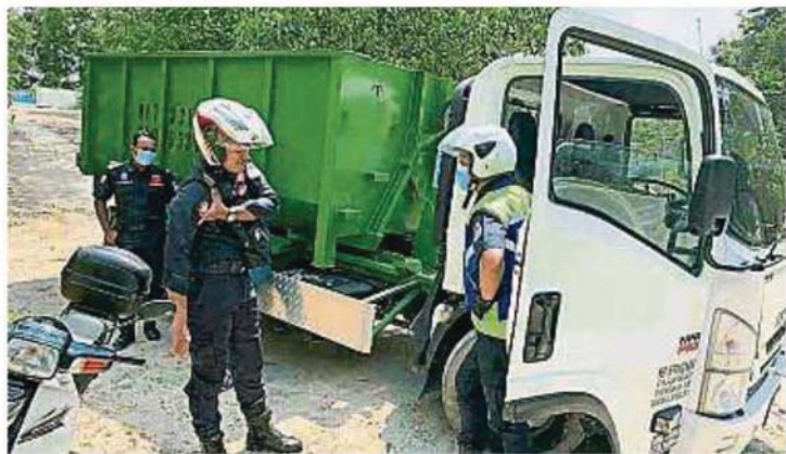
比起一般执法队伍,摩哆车巡逻队能深入普通车辆无法到达之处,包括日前成功取缔涉及非法倾倒垃圾活动的罗里。