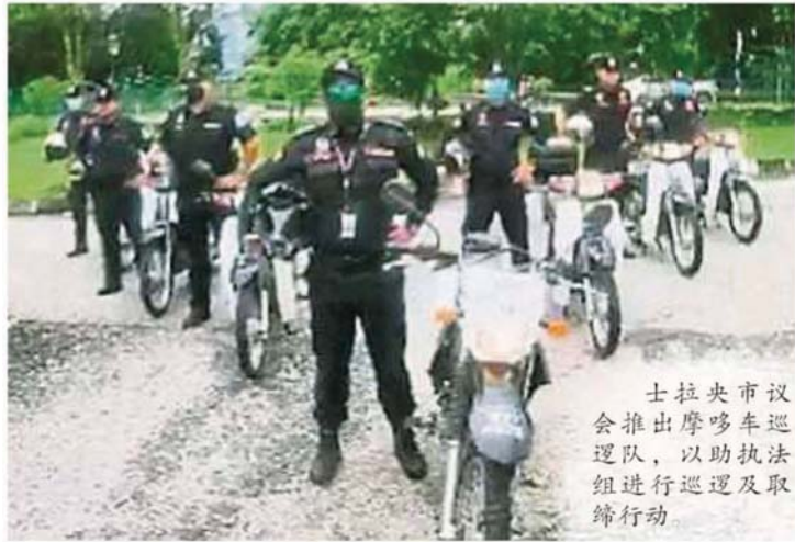
士拉央市议会推出摩哆车巡逻队,以助执法组进行巡逻及取缔行动。