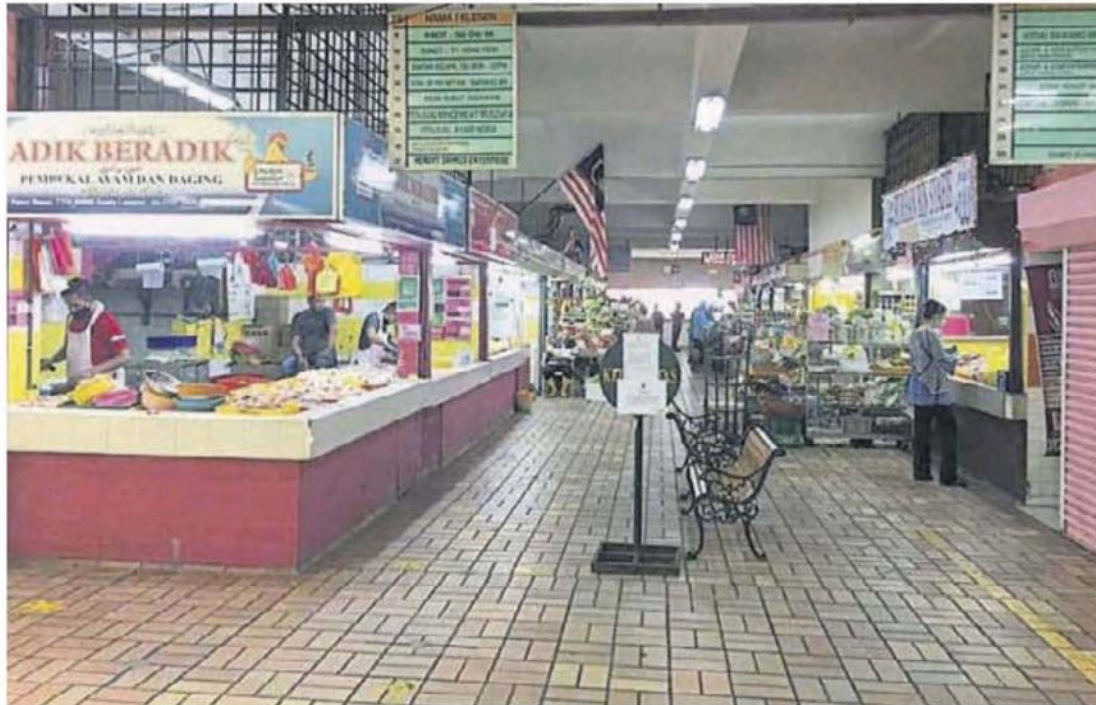
获准复工。 敦依斯邁花园巴刹原本被令关闭的摊位，周二