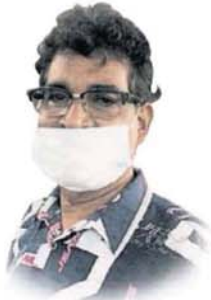
■巴尼尔：预计周五生意会恢复。

Provided for client's internal research purposes only. May not be further copied, distributed, sold or published in any form without the prior consent of the copyright owner.