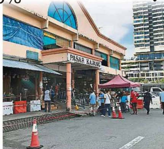
加影巴刹在周二(2日)重开后，人流大减，不少档販生意量只有巴刹关闭之前的两三成。

他们表示，巴刹在昨天已大扫除，环境变得干净卫生，市议会也会进行消毒，民众可安心前来巴刹购物。