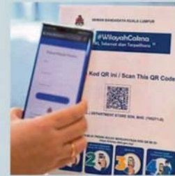
KLStep was rolled out by DBKL on May 28.

provide timely data to healthcare practitioners to better identify and treat potential Covid-19 patients.