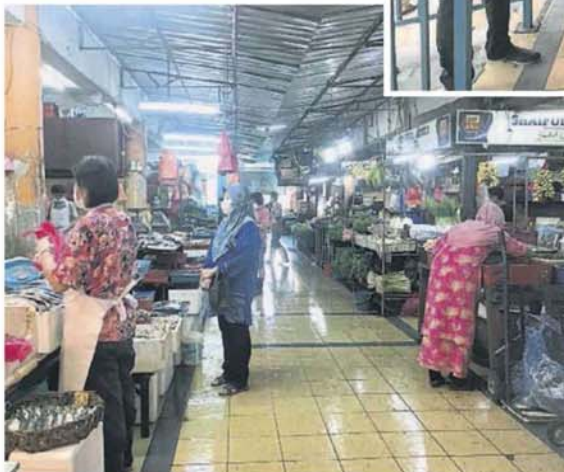
■巴刹内人潮比平日少很多。

乌冷卫生局上月为加影巴刹261名小贩与员工进行新冠肺炎检测,当中有5人检测结果呈阳性,市议会随后在5月20日下午关闭巴刹,直到今日才重开。