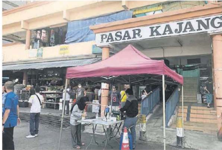
■加影巴刹关闭两周后周二已重开。

雪州行政议员许来贤说,加影巴刹5名确诊感染新冠肺炎的小贩与员工目前仍在医院隔离治疗,除此之外,加影州选区目前已没有新冠肺炎病例。