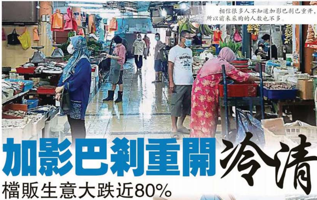
相信很多人不知道加影巴刹已重开， 所以前来采购的人数也不多。

Provided for client's internal research purposes only. May not be further copied, distributed, sold or published in any form without the prior consent of the copyright owner.