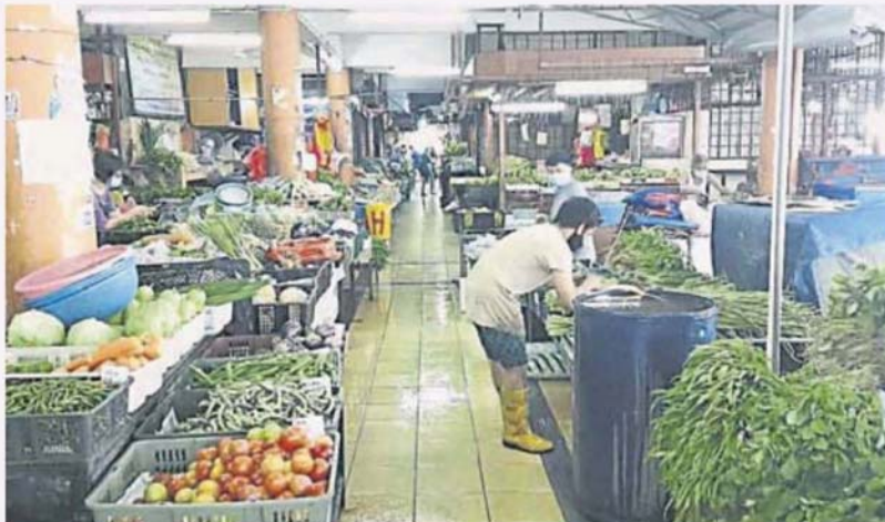
加影巴刹重开首天冷冷清清。

她说，昨天已通过 WhatsApp 顾客通知指巴刹今天会重开，但今天光顾的顾客少，很多人因为担心仍不敢到巴刹来。